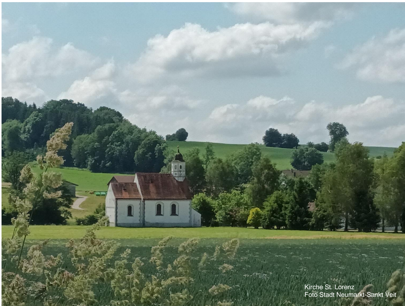
Kirche St. Lorenz

VERWALTUNGSGEMEINSCHAFT NEUMARKT-SANKT VEIT